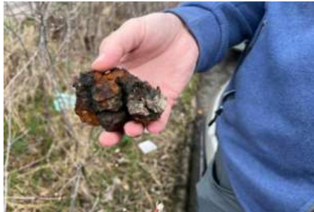
Ødegård viser en chaga, eller kreftkjuke, som han har funnet.

– Jeg mener ikke partiet er ekstremt. Vi står for en rettferdig politikk. Mange sier at vi er imot innvand-