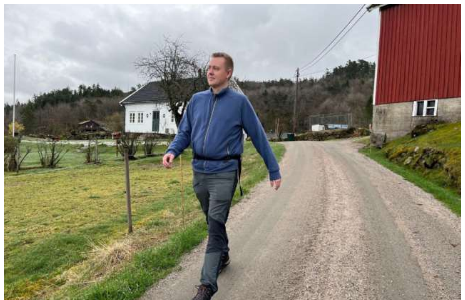
Familiegården på Røststad.