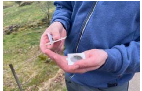
Sølvmynt fra 1869, Kong Carl den 15., Lykkeskilling fra 1771 dansk kong Chr den 7.

ring, men det er ikke riktig. Vi er for en kontrollert innvandring.